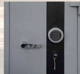
detalle sistema de cierre